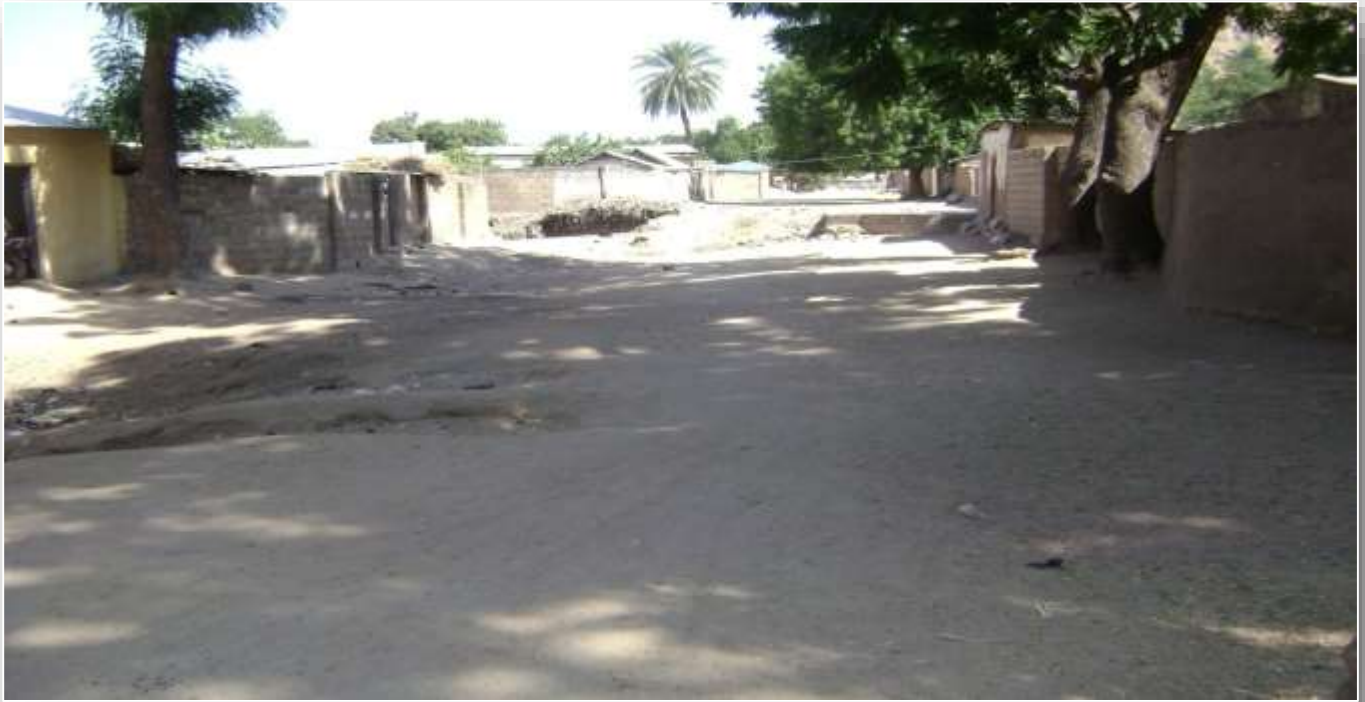
Photo 5 : Effet des eaux de ruissellement sur les maisons d'habitations