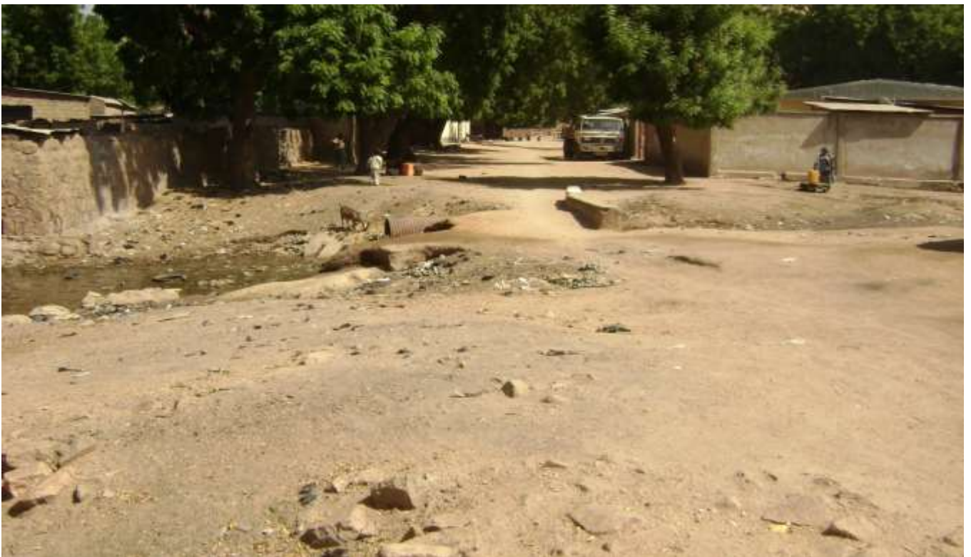
Photo 4 : Route et ouvrage d'art détruits par les eaux de ruissellement