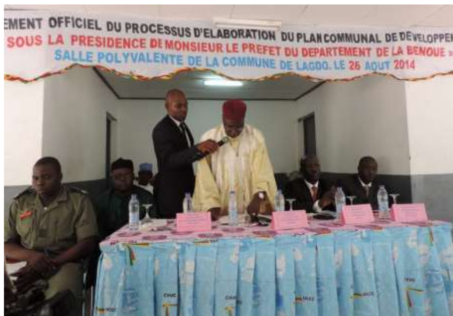
Photo 1 : Discours de Mr Le Préfet du Département de La Bénoué au lancement du processus d'actualisation du PCD de Lagdo le 26 août 2014.