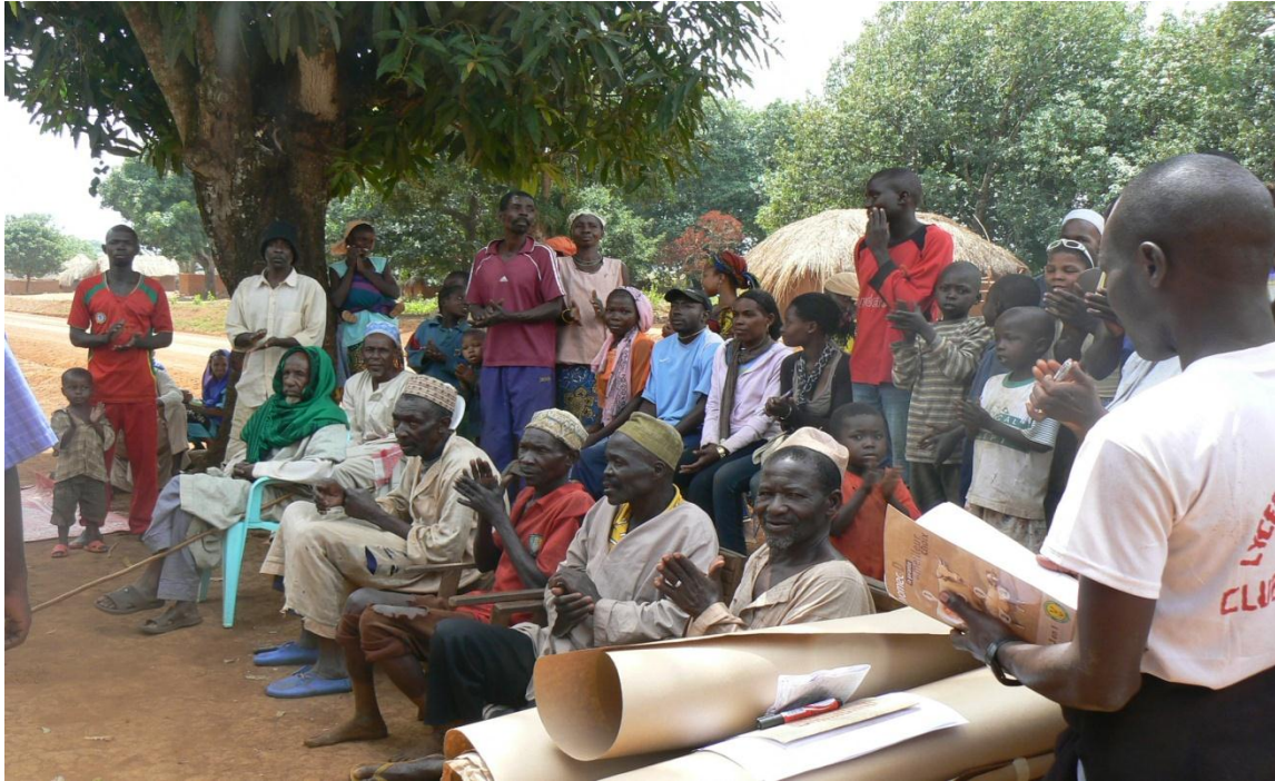
Photo 2: Formation pratique des planificateurs dans le village Zo'on

La phase opérationnelle a commencée par la collecte des informations et leur traitement.