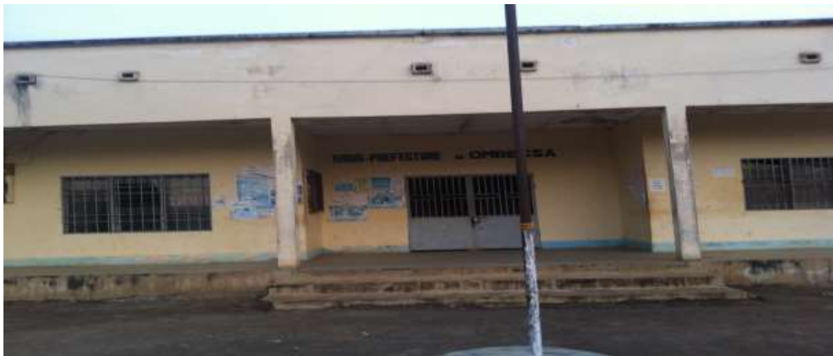
Photo 1: Sous/prefecture d'Ombessa qui abrite aussi les services de la recette(Mairie), la délégation des Affaires sociales et l'IAEB.

Une illustration de quelques unes est faite par les photos 1 et 2 ci-après: