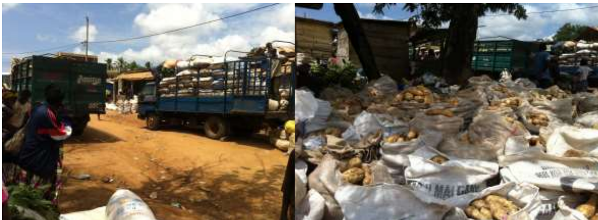
Photo 3: Vue d'un exemple du potentiel économique de la commune d'Ombessa (Jour de marché à Bessété)

La population d'Ombessa constituée d'ethnies GUNU, Bamiléké, Anglophones, Etons et quelques Foulbés estimée à environ 40 000 habitants, constitue également une ressource indéniable pour le développement de l'économie de la Commune.